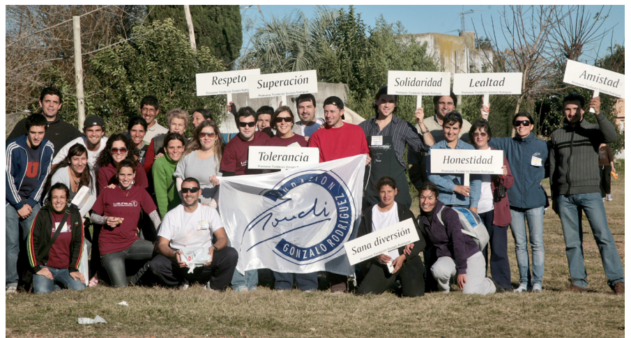
Equipo de trabajo del Programa.

Desde la Fundación, agradecemos a todas las organizaciones que hicieron que este evento fuera posible: Frigorífico La Dolfina, Panadería del Ejército Nacional, Molinos Río Uruguay, Policía Comunitaria de La Paz.