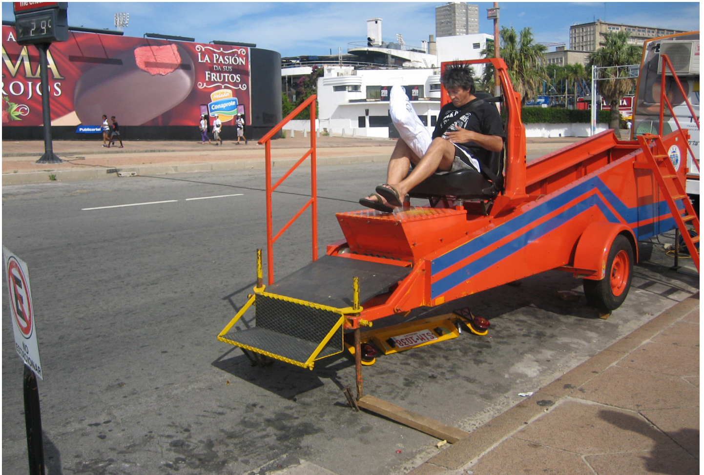
Actividad de verano con simulador: Fundación Gonzalo Rodríguez e Intendencia de Montevideo.