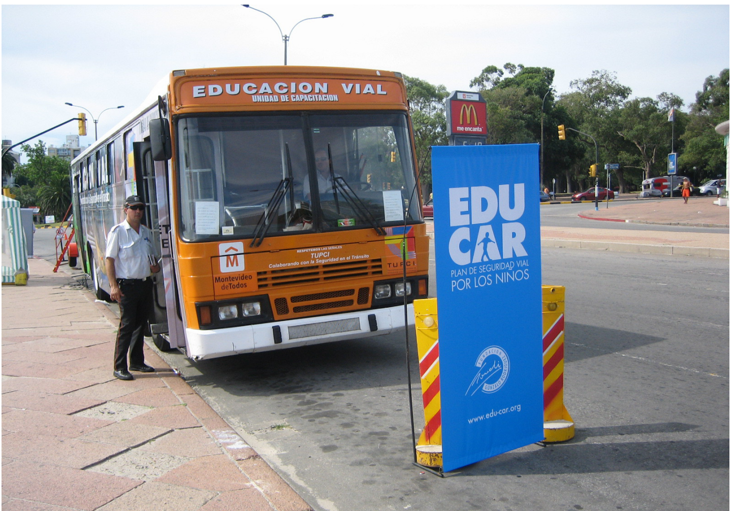
Actividad de verano con simulador: Fundación Gonzalo Rodríguez e Intendencia de Montevideo.