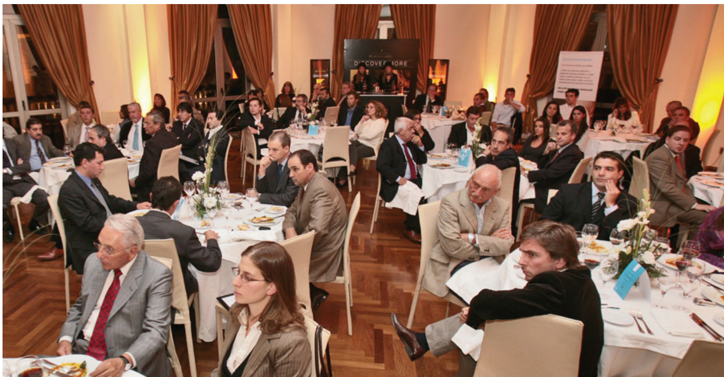
Evento en Rara Avis Restaurant.

Por otra parte los participantes tuvieron la posibilidad de sumarse a la Campaña Carreteras Seguras, llevada adelante por la Fundación FIA a través de la firma de pancartas de petición por “Una década de acción para la Seguridad Vial 2010-2020”.