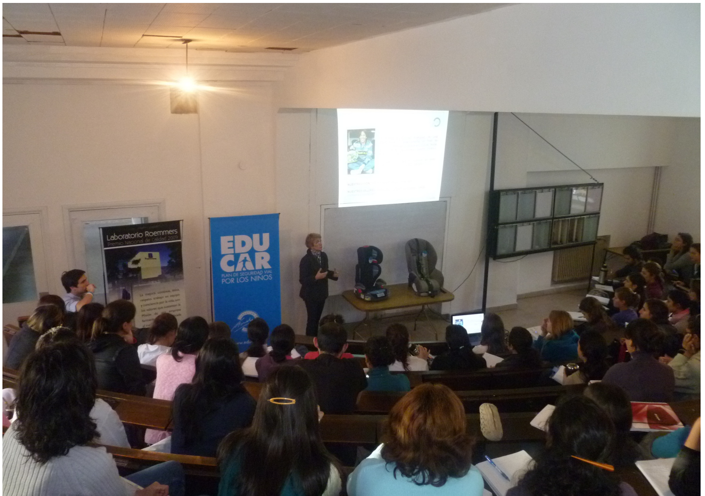
Charla de capacitación para estudiantes de Facultad de Medicina.