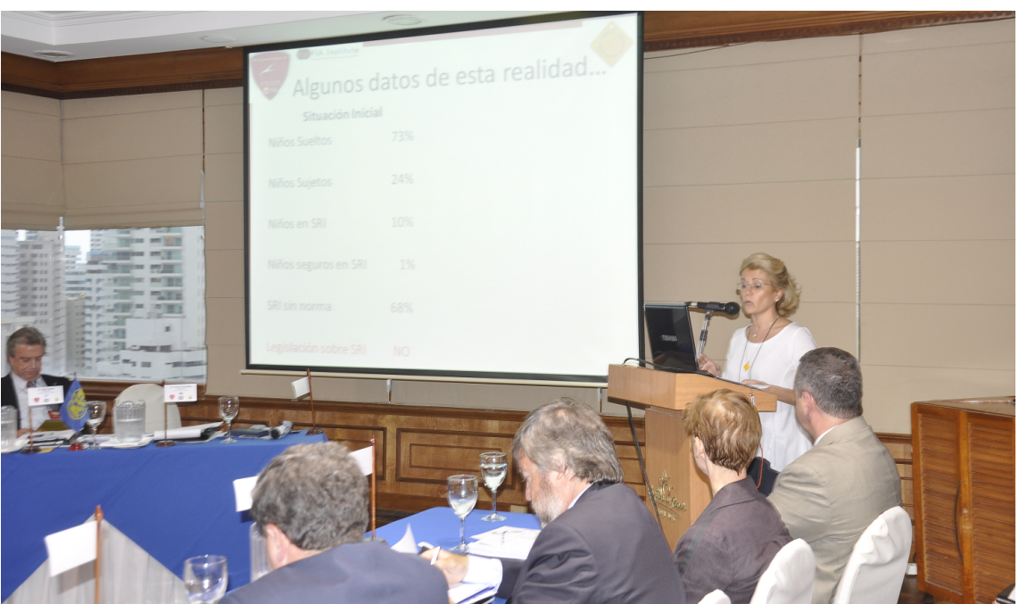
Rosa Gallego FGR realizando la presentación ante el Congreso FIA.