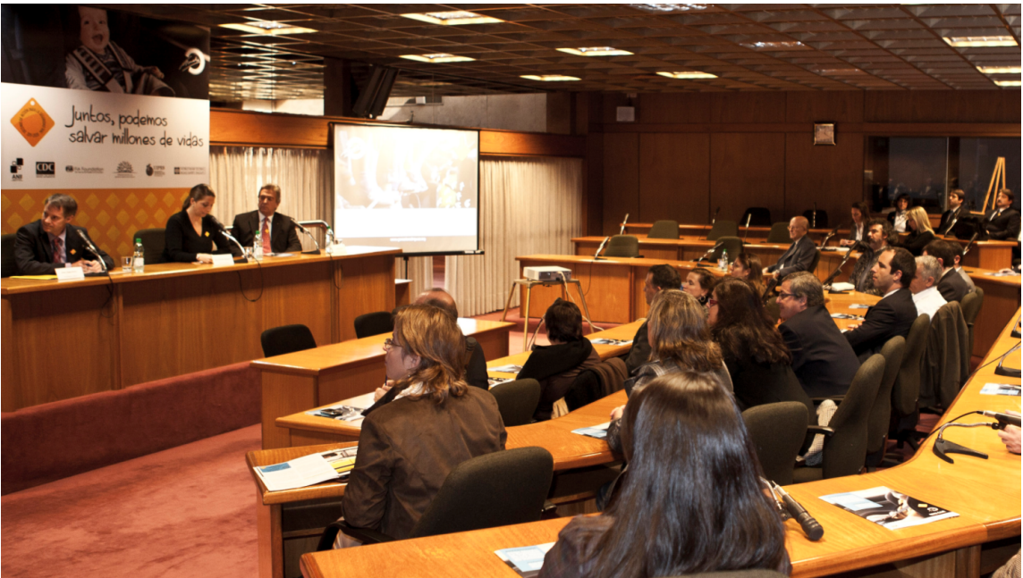
Presentación ante Parlamento, datos EDU-CAR.