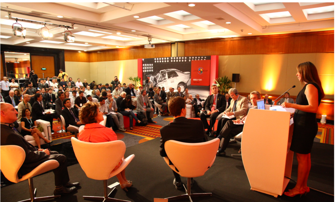
Presentación Latin NCAP 2011.