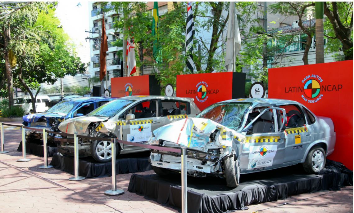
Exhibición de Automóviles Testeados.