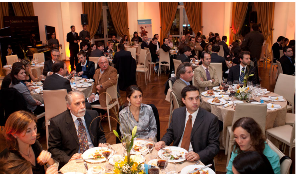
Empresas en Movimiento 2011.